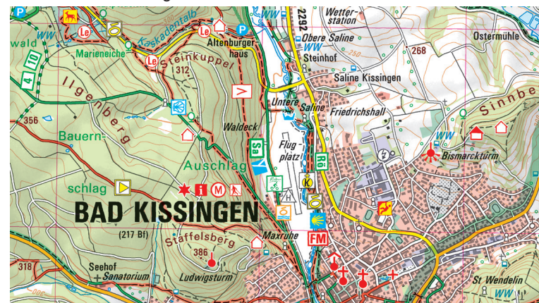
Ausschnitt aus UK50-1 Naturpark Bayerische Rhön

Wer mit der Familie das Freilandmuseum Fladungen besucht kann dies mit einer Fahrt im historischen Rhönzüge verbinden. Erholung und Ruhe hat man beim Kuren in einem der berühmten Bäder der Rhön wie der KissSalis Therme in Bad Kissingen und dem Kurhaus Bad Bocklet.